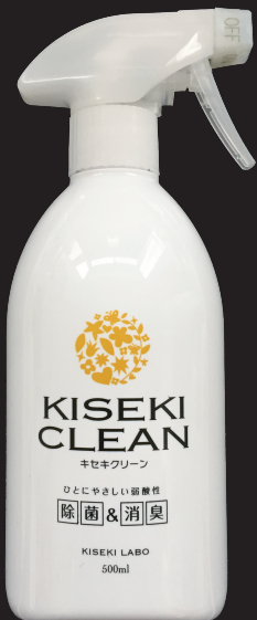
キセキクリーン500mL 1,280円(税別)

室内噴霧による感染防止・除菌・消臭、うがい、カビ対策 手指洗浄、アトピー対策、体臭処理、汚物処理