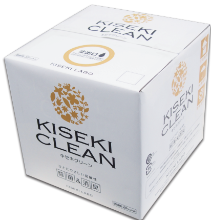
キセキクリーン詰替え用20L 12,800円(税別)