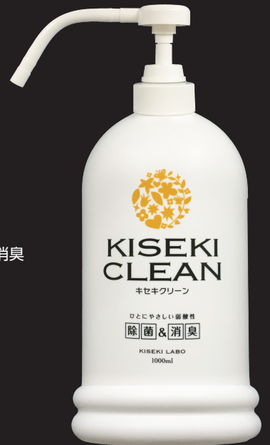
キセキクリーン1000mL 1,980円(税別)